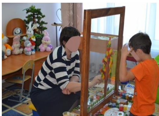
Рис. 4. Совместный рисунок с мамой «Осеннее дерево»