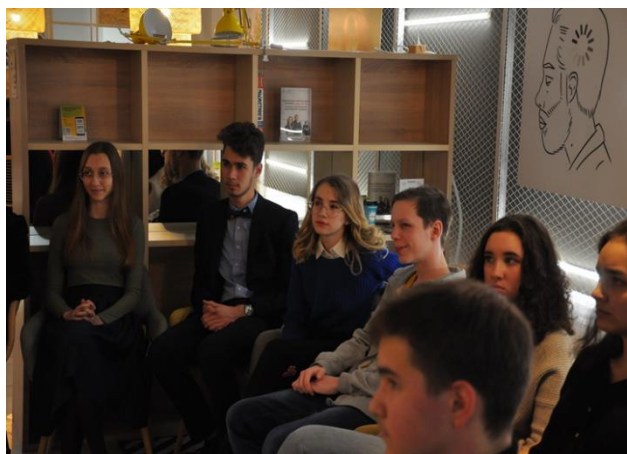
Рис. 9. Участники реализации проекта