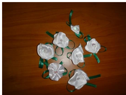
Рис. 7. Белые цветки, изготовленные участниками благотворительного проекта

В общей сложности в подготовленных мероприятиях приняли участие 83 человека из МБОУ гимназия № 161 (обучающиеся, педагоги, родители).