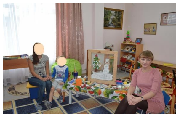
Рис. 3. Совместный рисунок с мамой «Зима пришла»