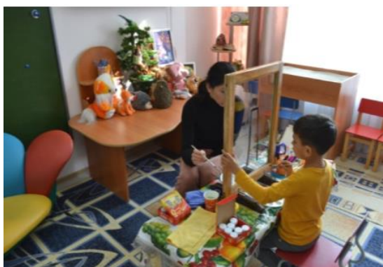
Рис. 2. Совместная творческая деятельность

Идея заключается в создании «прозрачных отношений» между ребенком и мамой. Пример совместной деятельности в рамках данного занятия см. рис. 2–5 1 .