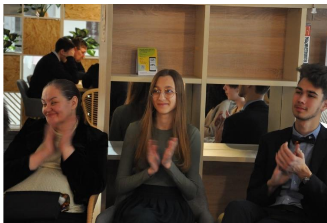
Рис. 10. Участники реализации проекта

Интересным и вполне закономерным результатом проведенных встреч является появление новых социальных контактов, начало дружеских отношений, в основе которых лежит общность интересов.