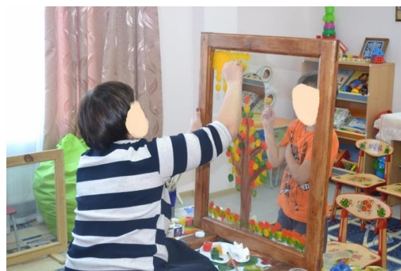
Рис. 5. Совместный рисунок с мамой «Осеннее дерево».

На данном занятии родитель смотрит на мир с позиции ребенка, отрывается от повседневных забот и вместе с ребенком создает продукт совместной творческой деятельности. В памяти через реальные действия закрепляется чувство «я могу понимать», «я могу принимать ребенка», «я могу чувствовать своего ребенка» и в итоге «я могу быть успешным родителем!». Результат совместной творческой деятельности – совместный рисунок – с разрешения родителей запечатлен на фото и видео. Пережитый позитивный опыт, с чувством «я могу быть успешным родителем», создает ресурс в памяти для дальнейшего воспитания ребенка и совершенствования своих родительских компетенций.