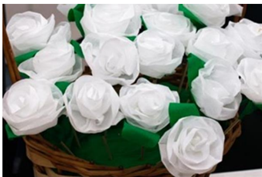
Рис. 6. Белые цветки, изготовленные участниками благотворительного проекта